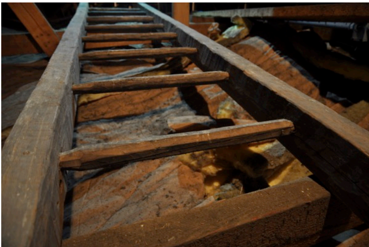
Vissa av stegpinnarna har ansetts för grova och huggits ned i dimension.