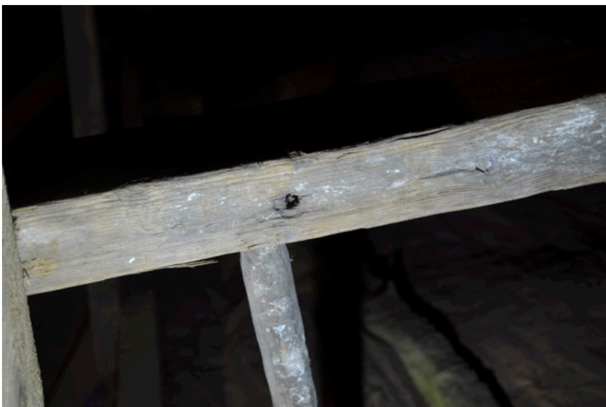
Spikhål med avtryck från spikskallen, kanske för att stegen varit fast monterad.