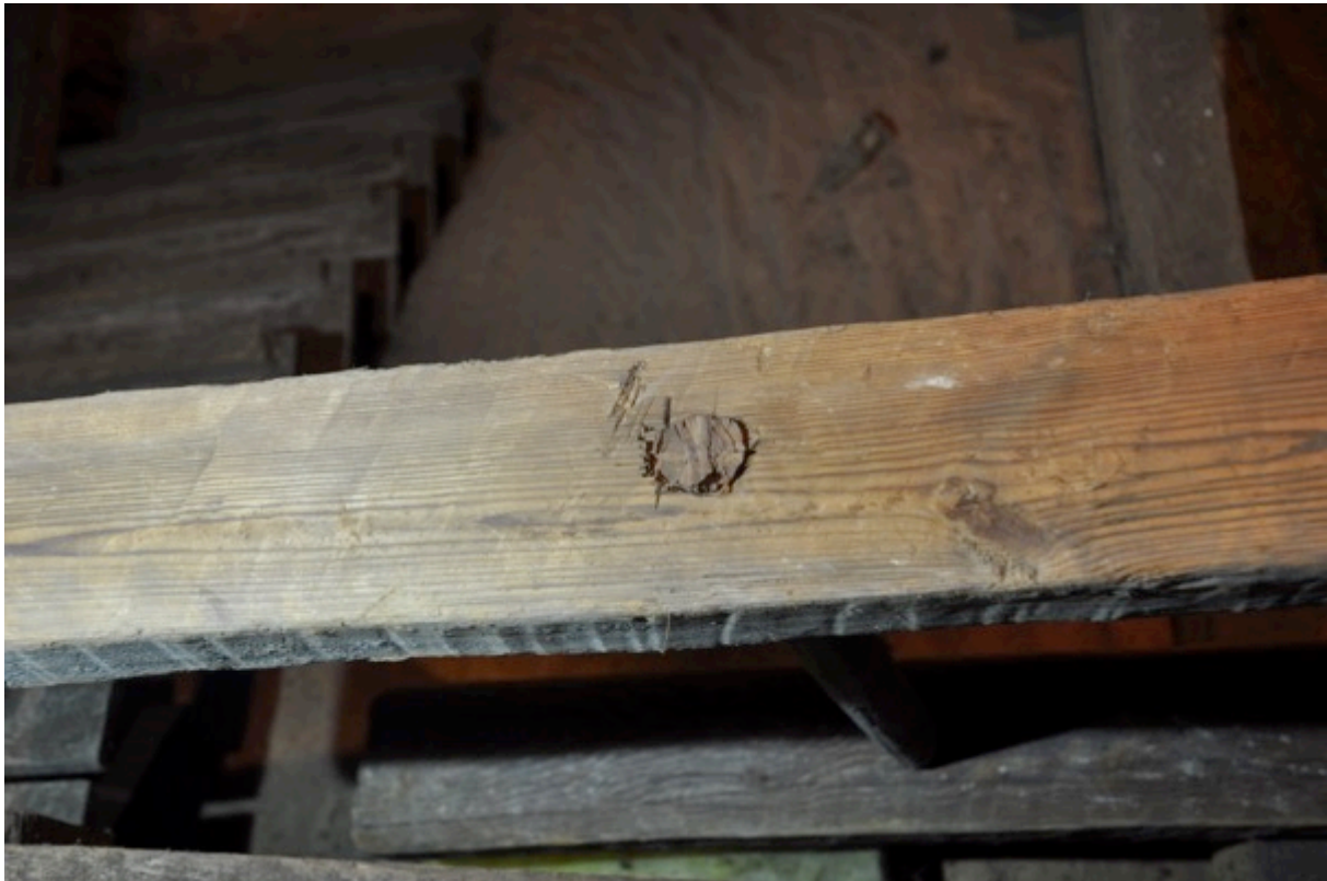
Kilning av stegpinnar.