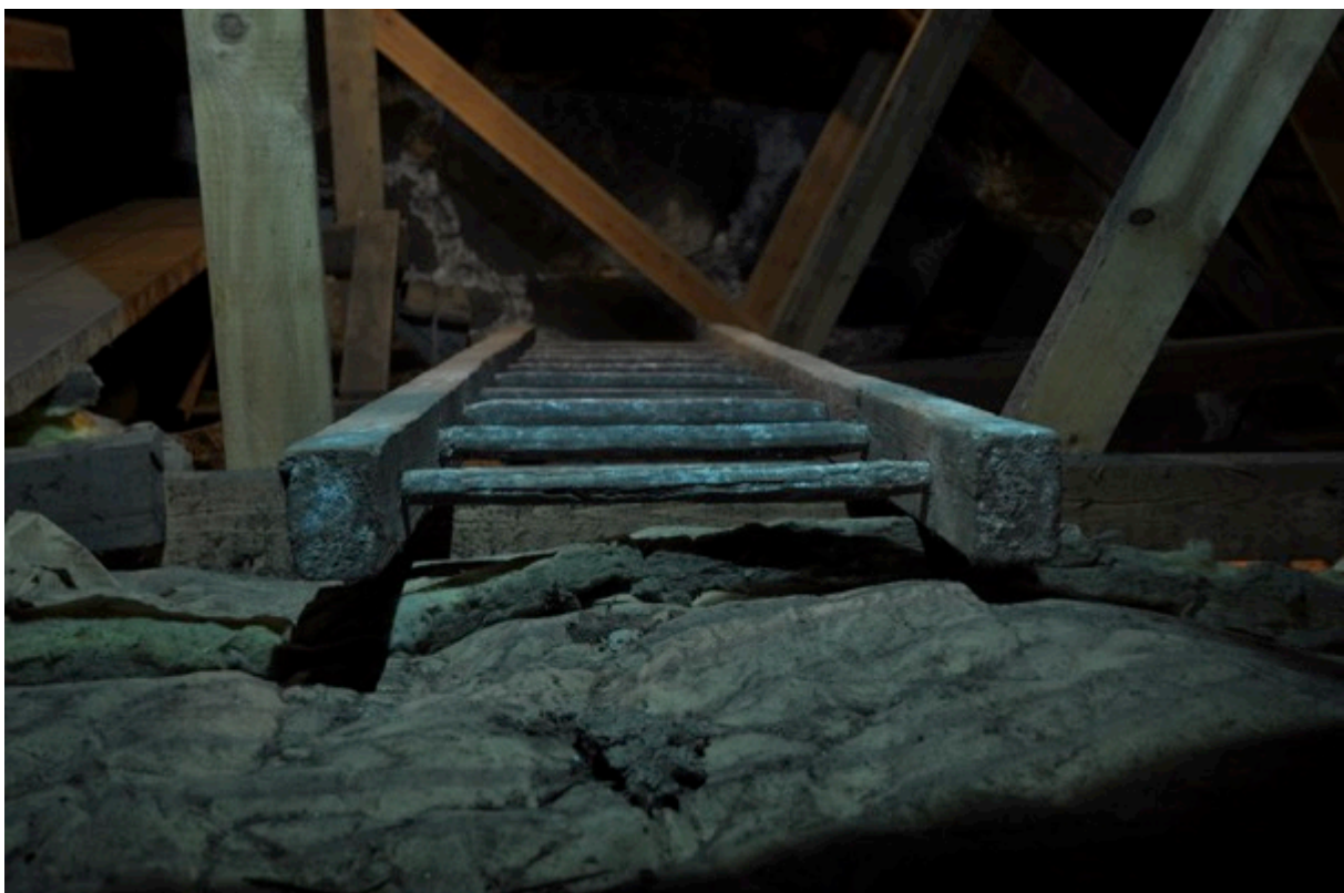
Ändarna är fint avkapade.