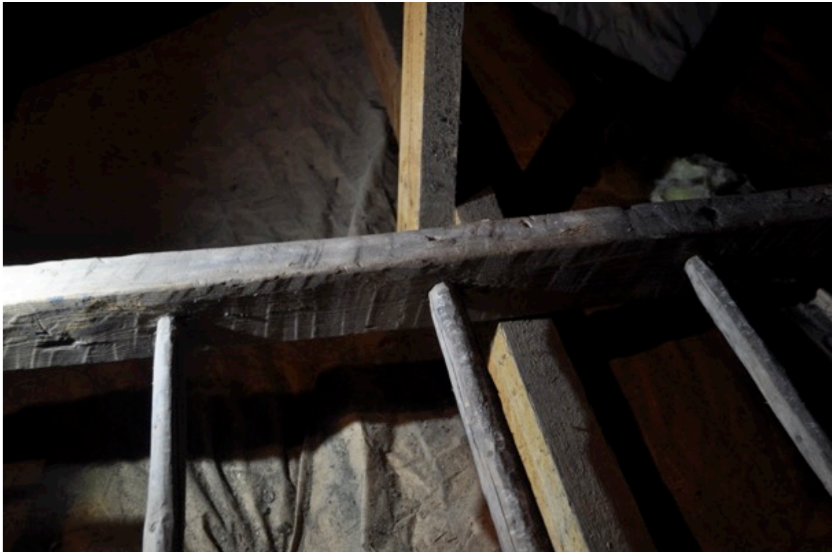
Sprätthuggning. Till höger syns ett spikhål.