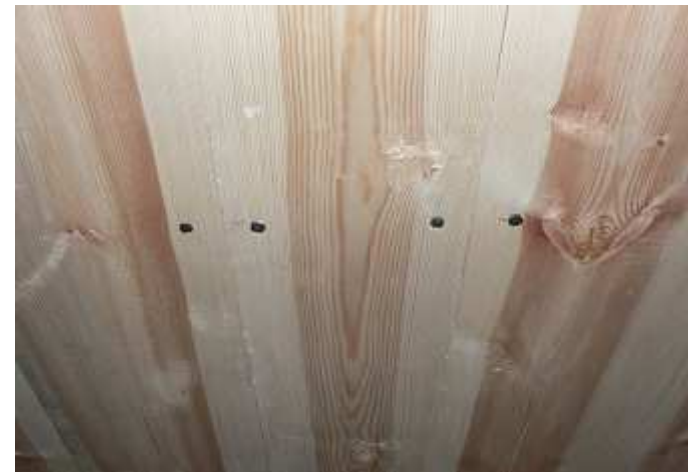
Furubrädor och handsmidd spik